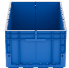
TABLA DE ESPECIFICACIONES TÉCNICAS: